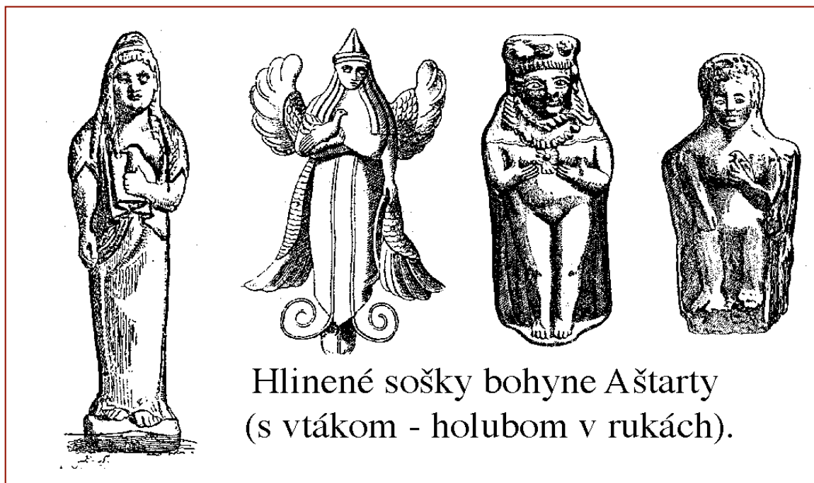
Hlinené sošky bohyně Aštarty (s vtákom - holubom v rukách).

Postupom času sa zobrazovala bez šiat a s vtákom-holubom v rukách 32 (odtiaľ výrazy nahý = holý ). Jej pripisovali na vrub stvorenie sveta a rovnako neexistujúci vopred stanovený "osud" človeka.