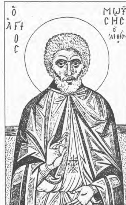
Prepodobný Mojsej Murin

Keď sa alexandrijský patriarcha Teofil dozvedel o svätosti života Mojseja,