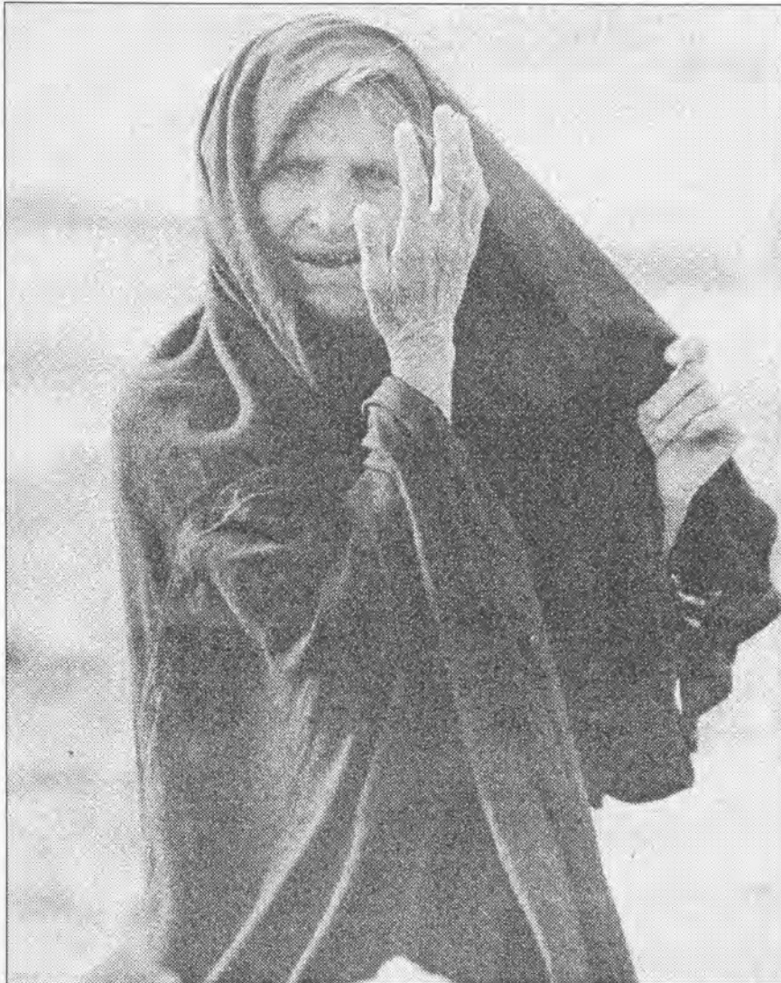
Muslimanka, vydatá žena, si musí na verejnosti zakrývať svoju tvár ( Korán 33,59). Túto však zachytil fotoaparát v nestráženej chvíli...

Muslimani, teda ľudia, ktorí vyznávajú islamské náboženstvo (boha Alaha a proroka Mohameda), si môžu brať za ženy inoverkyne (kresťanky alebo židovky, porov. Korán 5,5; 60,10), pretože podľa mentality ich nekresťanského náboženstva, ktoré vzniklo v 7. storočí po Christovi, žena nasleduje a prechádza au-